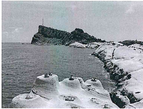
圖 2：台灣地景保育網任選一張地質公園的照片