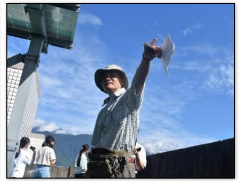
圖 3-5 地理科歐漢文老師指導學生 GIS 課程實地探查