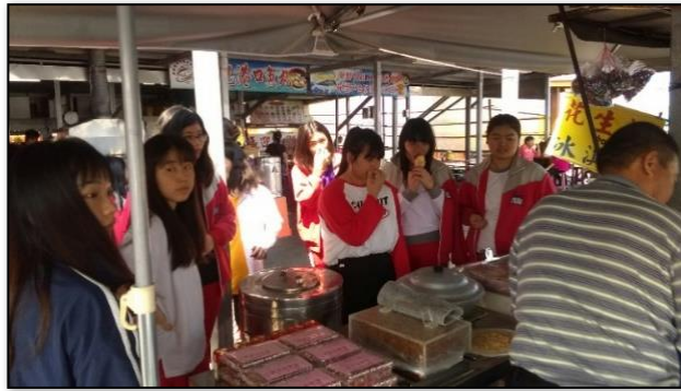
圖 3-4 花蓮漁港魚市場踏查活動