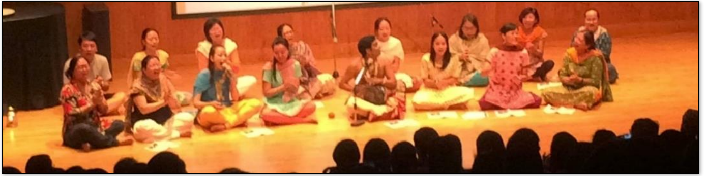
圖 3-3 學校辦理多元文化講座：印度傳統舞蹈文化演講