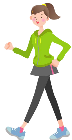
組圖 3-2 花女目不暇給、豐富多元的社團活動