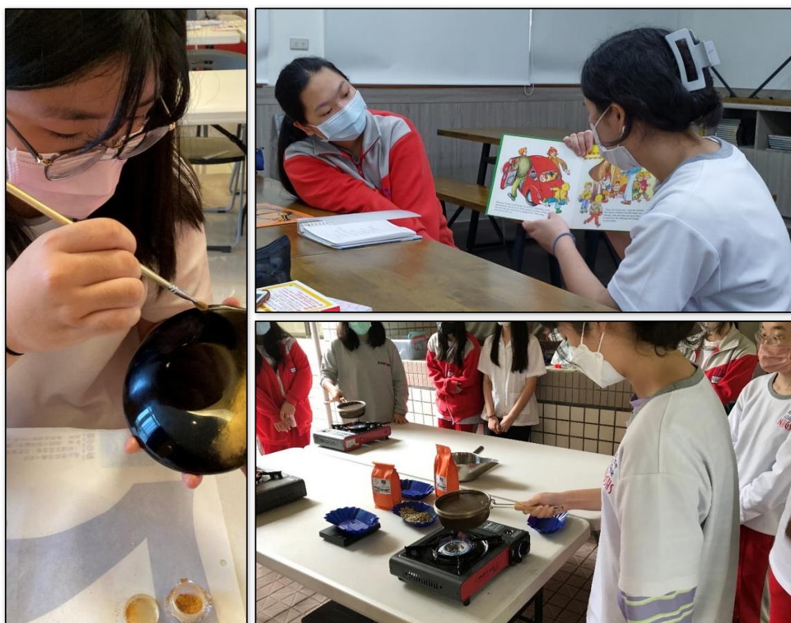
組圖 3-1 開設微課程以增進學生興趣探索、學習技巧或特殊技能