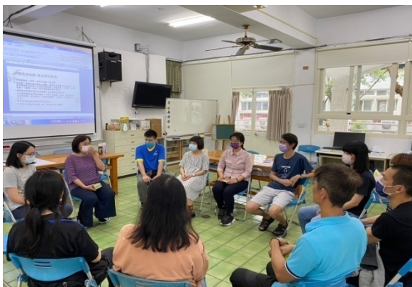
二級介入性輔導：二級個案認輔教師研習