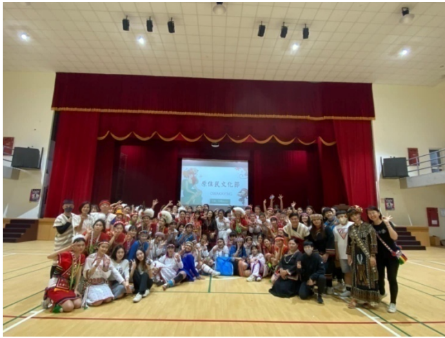
一級發展性輔導：花女原住民文化節(112.4.6)