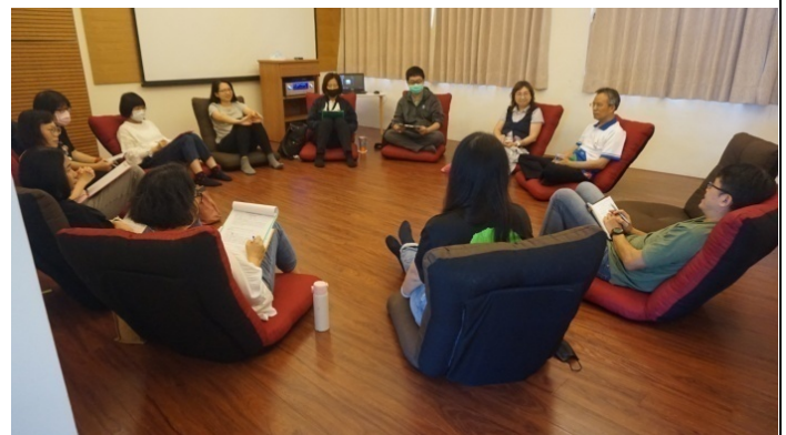
二級介入性輔導：花蓮區輔導教師團體督導