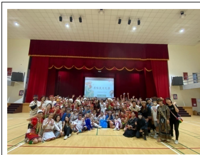
一級發展性輔導：花女原住民文化節(112.4.6)