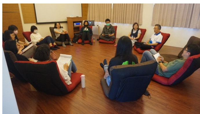
二級介入性輔導：花蓮區輔導教師團體督導