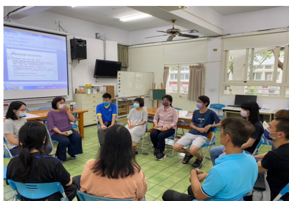
二級介入性輔導：二級個案認輔教師研習