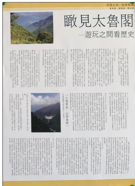
圖 1-1、1-2 洄瀾之心 110-2 票選得獎作品展